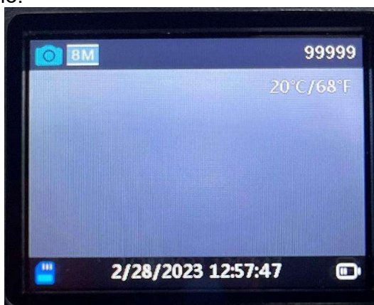
Figura 3 Visualizzazione delle informazioni di anteprima

Quando la fotocamera entra in modalità "SETUP" , le impostazioni correnti vengono visualizzate sullo schermo.