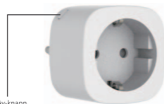
På/Av-knapp Trykk lenge for å fabrikkinnstillinger