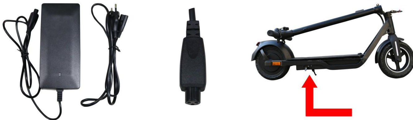
Priključak za punjenje

Priloženi prilagodnik napona spojite na priključak za punjenje električnog romobila.