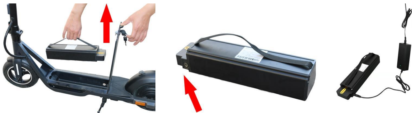
Priključak za punjenje