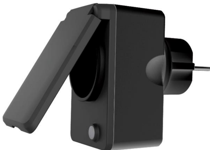
DENVER PLO-109 outdoor power plug