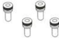
Vijak za pričvršćivanje upravljača x 4